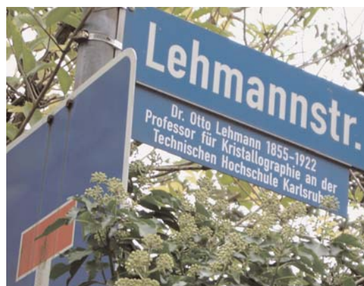
▲ Bild 3: Kein Weg in die Sackgasse: Otto Lehmanns Forschungen auf dem Gebiet der Flüssigkristalle

1919 wurde Lehmann aus gesundheitlichen Gründen frühpensioniert. Sein Nachfolger als Institutsleiter in Karlsruhe wurde Wolfgang Gaede (vgl. Karlsruher Transfer Nr. 31). Mehrfach war er nach 1913 für den Nobelpreis nominiert, zuletzt in seinem Todesjahr 1922. Seit dem gleichen Jahr trägt eine Straße auf dem Campus der Universität den Namen "Lehmannstraße".