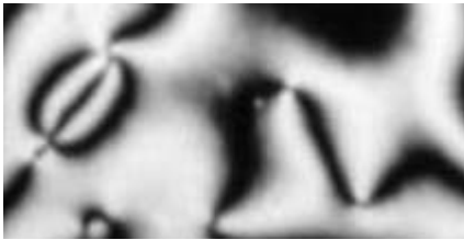
Bild 1: Polarisationsmikroskopische Aufnahme eines Flüssigkristalls